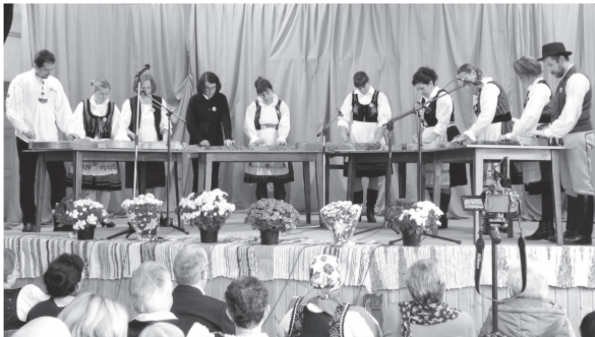
Mintegy száz citerás pengette meg a húrokat a hét végén Jedden