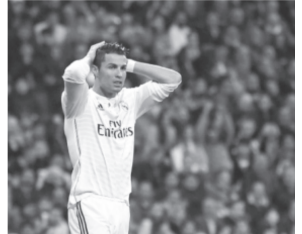
A csapata becsületgőlját jegyző portugál futballista szerint nem nagyon fontos, ami most történik

Zinedine Zidane irányításával a BL elmúlt két kiírásának győztese először szenvedett vereséget két egymást követő mérkőzésen, ennek ellenére a francia szakember is úgy véli, nincs ok a pánikra. „Sokan kérdezik, hogy aggódom-e, de nem. Nem is fogok, akármilyen történik. Nem vagyunk jó formában, de van időnk javítani ezen” – jelentette ki Zidane, aki elismerte, hogy a Tottenham megérdemelten gyűjtötte be a három pontot.