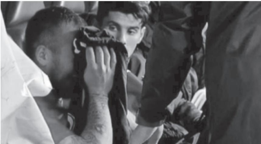
A FCSB játékosa igyekezett elrejteni könnyeit