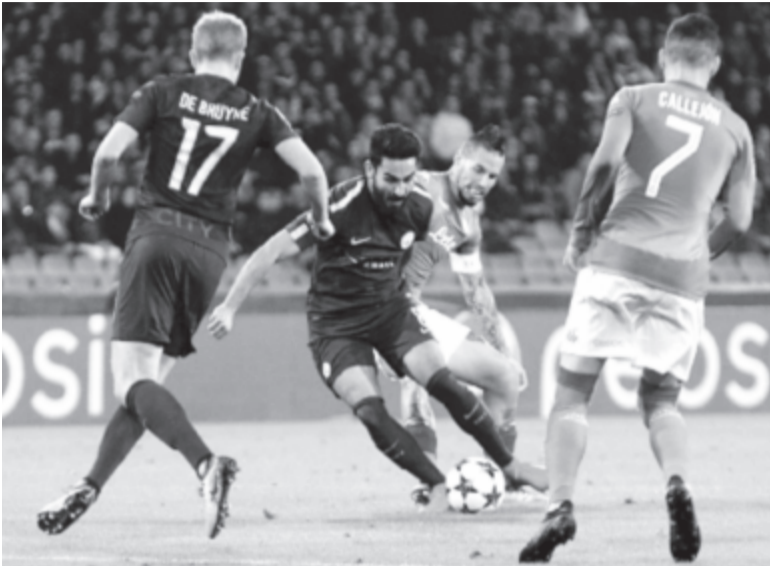
A Manchester City a Napoli vendégeként is nyert, így továbbra is százszázalékos a legrangosabb európai kupasorozatban

A Tottenham Hotspur és a százszázalékos Manchester City is győzelemmel jutott tovább szerdán a labdarúgó Bajnokok Ligája csoportköréből.